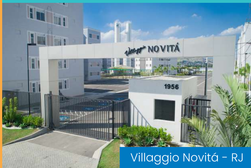
Villaggio Novità - RJ