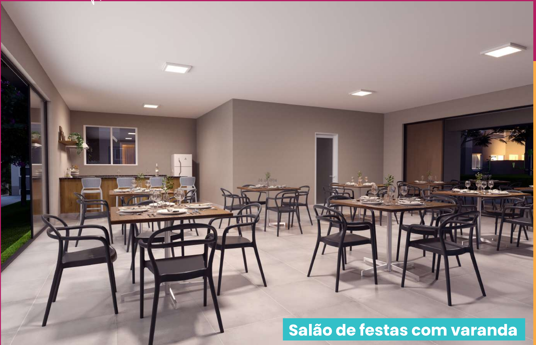
Salão de festas com varanda