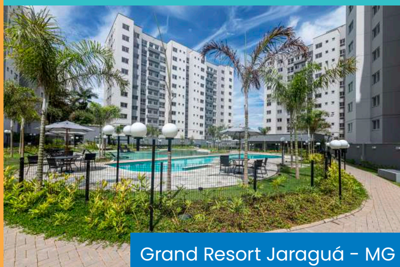
Grand Resort Jaraguá - MG

A Novolar se compromete a fazer sua vida melhor em cada detalhe. Por meio da qualidade de suas obras e em todos os processos da construção, reafirmamos o nosso compromisso desde o projeto até a entrega dos apartamentos. Cuidando sempre com muito carinho de cada etapa da construção do seu sonho.