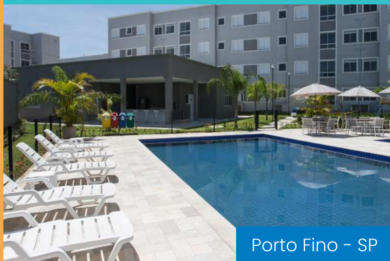
Porto Fino - SP