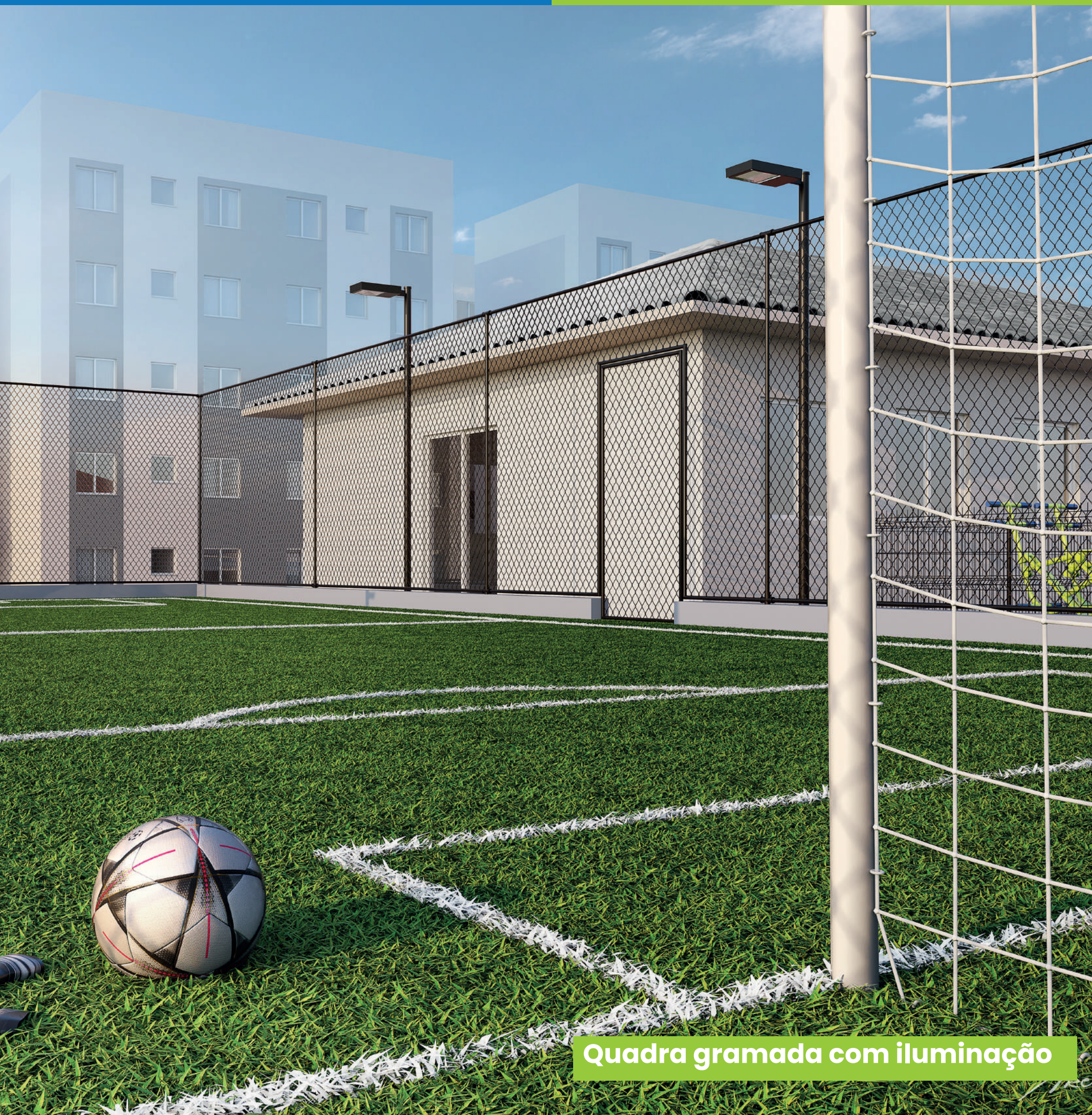
Quadra gramada com iluminação