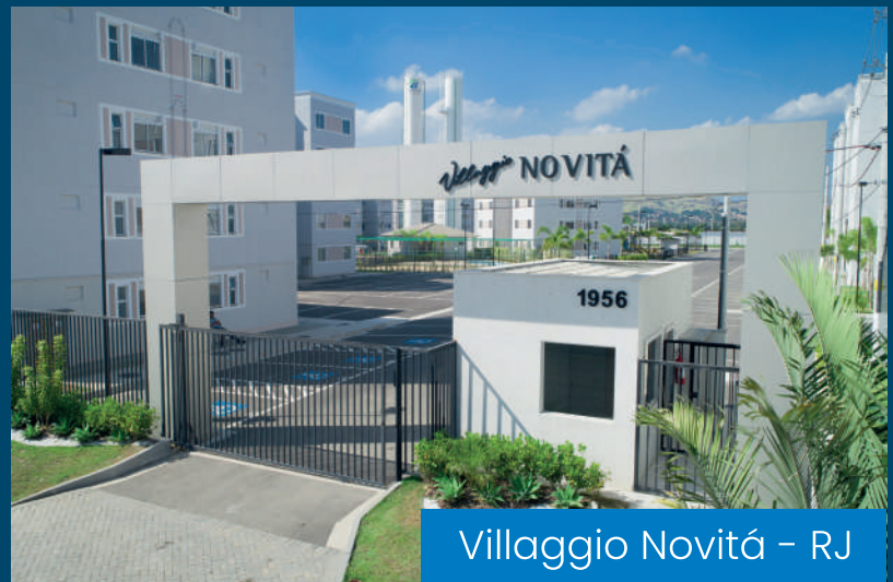
Villaggio Novitá – RJ