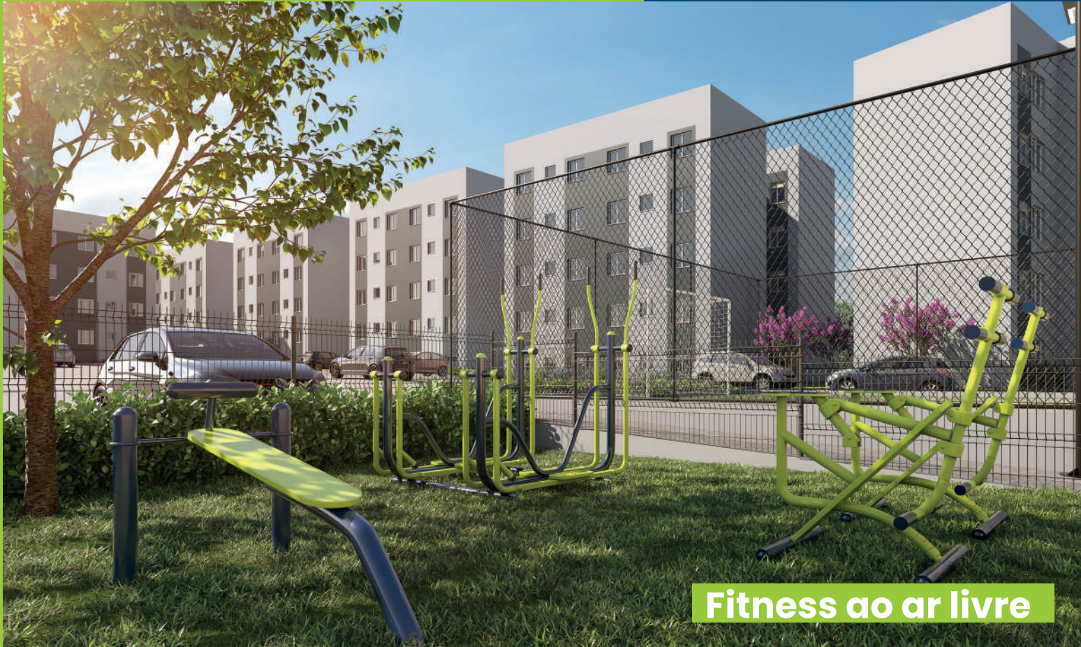
Fitness ao ar livre