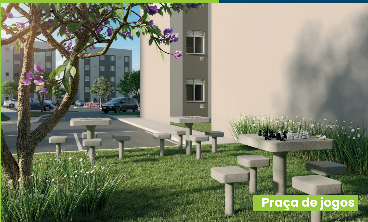
Praça de jogos