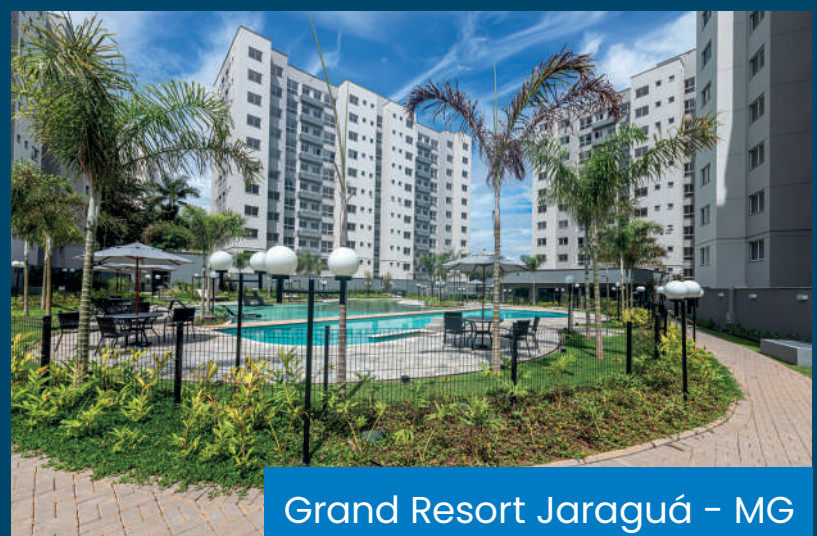
Grand Resort Jaraguá – MG

A Novolar se compromete a fazer sua vida melhor em cada detalhe. Por meio da qualidade de suas obras e em todos os processos da construção, reafirmamos o nosso compromisso desde o projeto até a entrega dos apartamentos. Cuidando sempre com muito carinho de cada etapa da construção do seu sonho.