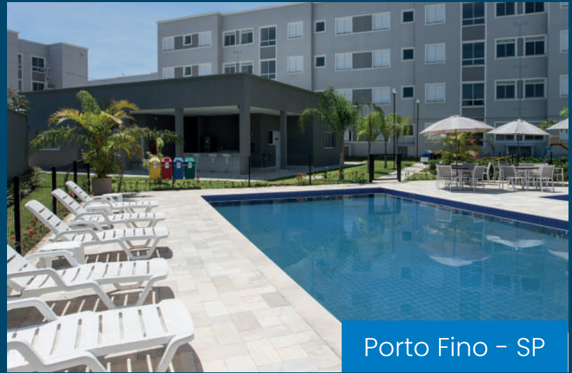
Porto Fino – SP