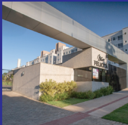
MIA FELICITÁ Santa Luzia - MG