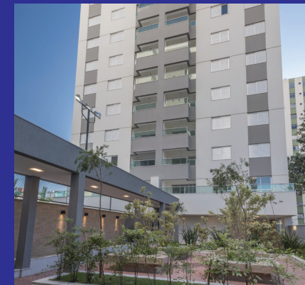
BROOKLYN Belo Horizonte - MG