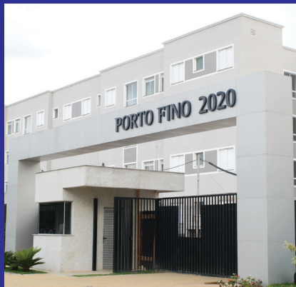
PORTO FINO Taubaté - SP

Agora, é a sua vez de ter o seu Novolar.