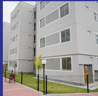
VILLAGGIO VENTURA Rio de Janeiro - RJ