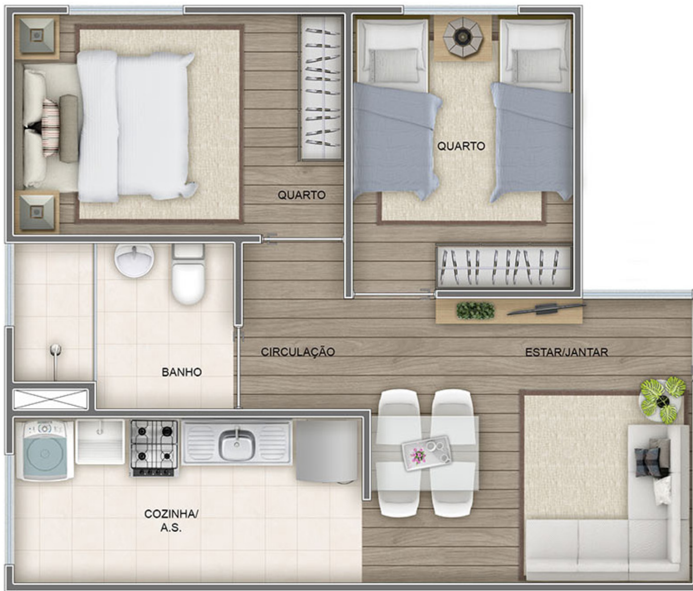
Apartamento tipo FINAL 03